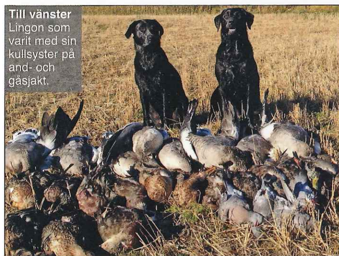
Till vänster Lingon som varit med sin kullsysster på and- och gäs jakt.