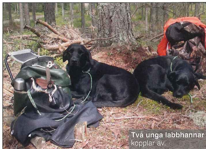
Två unga labbhannar kopplar av.