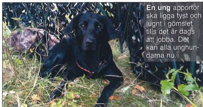
En ung apportör ska ligga tyst och lugnt i gömslet tills det är dags att jobba. Det kan alla unghundarna nu.