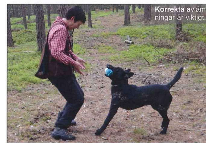
Korrekt avlämning är viktigt.