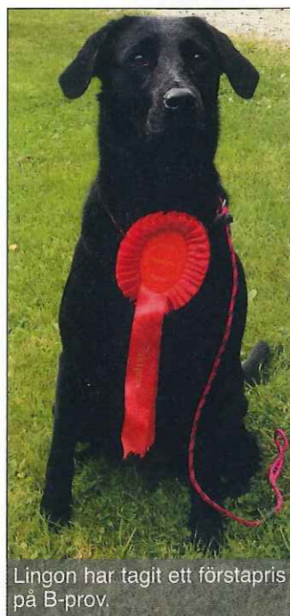
Lingon har tagit ett förstapris på B-prov.

"Walle och jag har fått gå med en rutinerad apportör, som Prao.