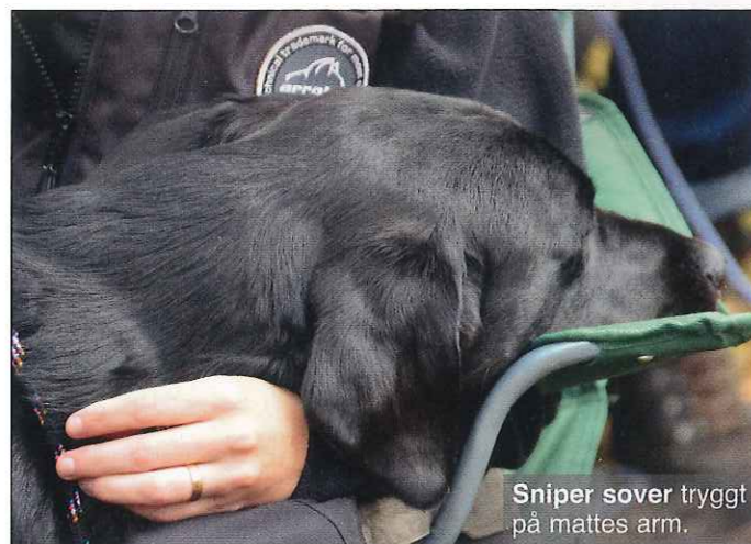
Sniper sover tryggt på matts arm.