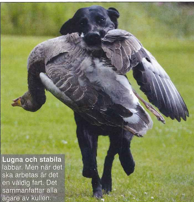
Lugna och stabila labbar. Men när det ska arbetas är det en väldig fart. Det sammanfattar alla ägare av kullen.

I början av juni åkte fyra av nio i kullen på unghundsderby till