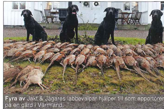
Fyra av Jakt & Jägares labbevalpar hjälper till som apportörer på en gård i Värmland.

Om den kan sitta still och vänta utan att göra någonting, länge, länge. Det är ju så en labrador ska fungera när den är på jakt.