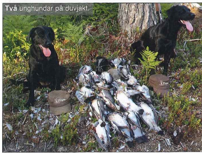
Två unghundar på duvjakt.