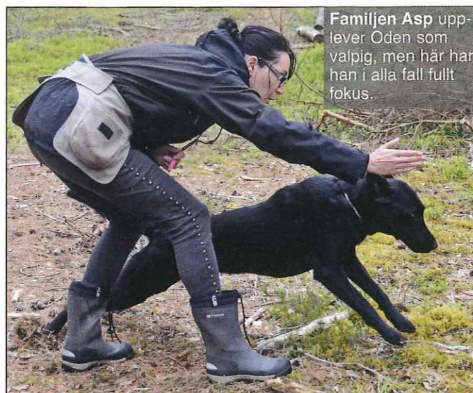
Familjen Asp upplever Oden som valpig, men här har han i alla fall fullt fokus.