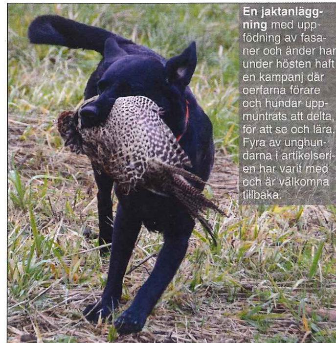
En jaktanläggning med uppfödning av fasaner och änder har under hösten haft en kampanj där oerfarna förare och hundar uppmuntrats att delta, för att se och lära. Fyra av unghundarna i artikelserien har varit med och är välkomna tillbaka.