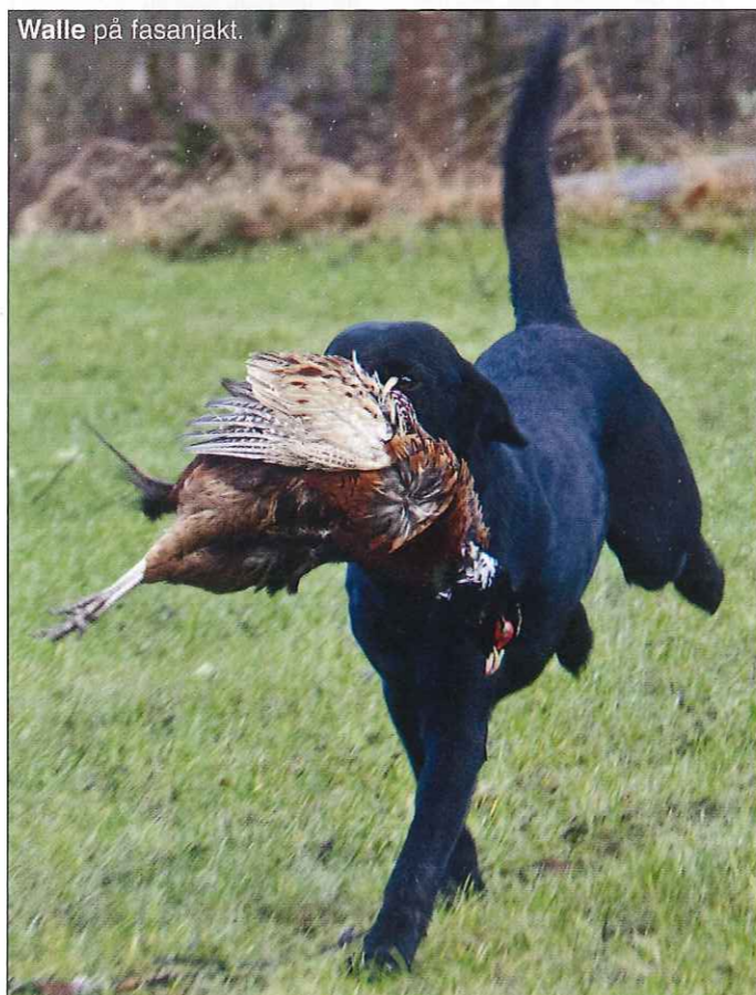
Walle på fasanjakt.